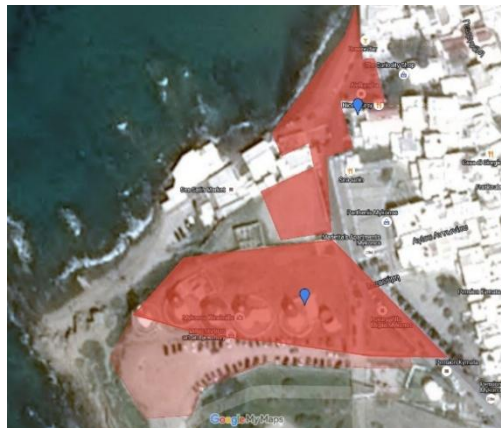
Ζώνη 2: Περιοχή Αλευκάνδρας- Μύλων