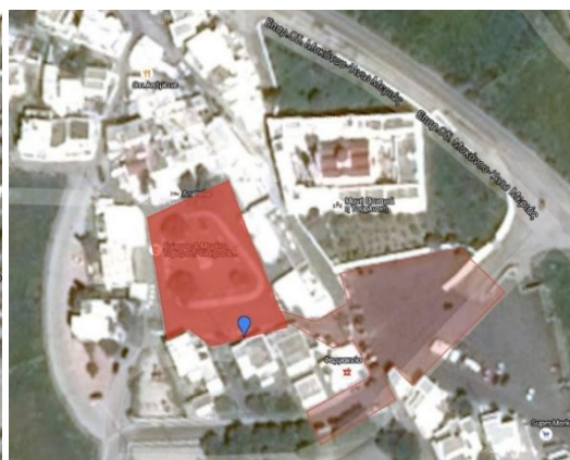
Ζώνη 4: Άνω Μερά